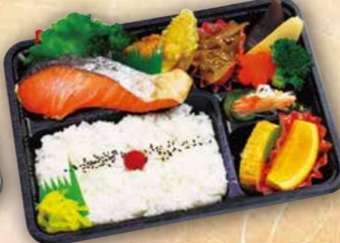
28 サケ弁当 本体価格 600円 (税込 648円)