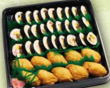
45 巻き寿司いなりセット 本体価格 2,000円 (税込 2,160円)