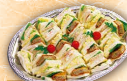
38 パーティーサンドセット 本体価格 2,000円 (税込 2,160円)