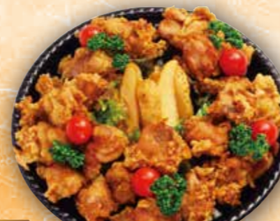
37 から揚げ&ポテトセット 本体価格 2,000円 (税込 2,160円)