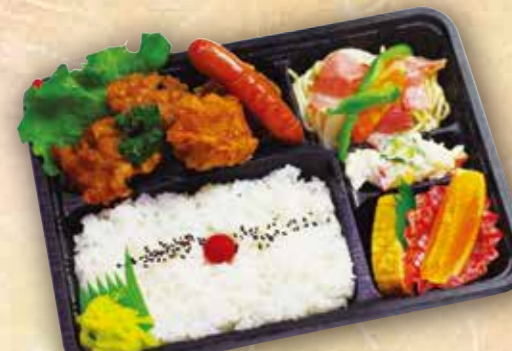
26 鶏から揚げ弁当 本体価格 600円 (税込 648円)