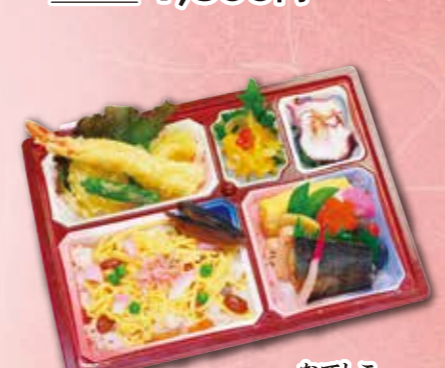
10 会席弁当“撫子” なでしこ 紙箱入り 本体価格 1,100円 (税込 1,188円)