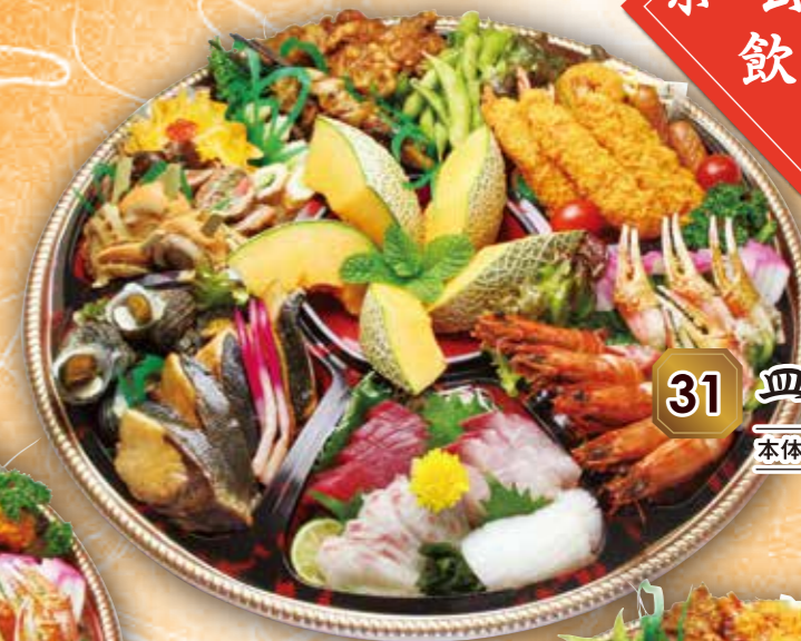
31 皿鉢 "響き" ひびき 本体価格 12,000円 (税込 12,960円)