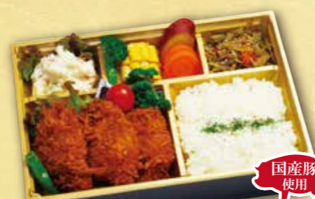
16 国産豚ヒレカツ弁当 国産豚使用 紙箱入り 本体価格 1,500円 (税込 1,620円)