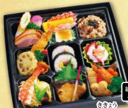
13 松花堂弁当“桔梗” ききょう 紙箱入り 本体価格 1,500円 (税込 1,620円)