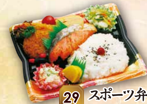
29 スポーツ弁当A 本体価格 500円 (税込 540円)