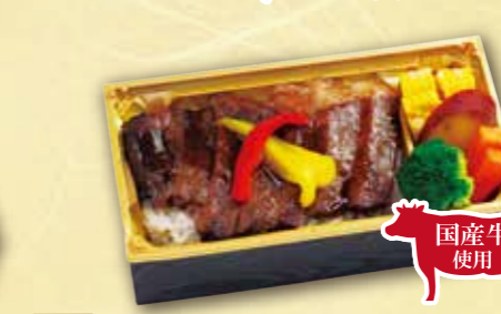
20 国産牛ステーキ丼 国産牛使用 紙箱入り 本体価格 1,800円 (税込 1,944円)