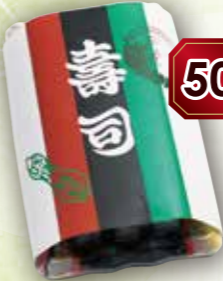
50 巻き寿司2本入り おみやげ用(折りかけ付) 本体価格 680円 (税込 734円)