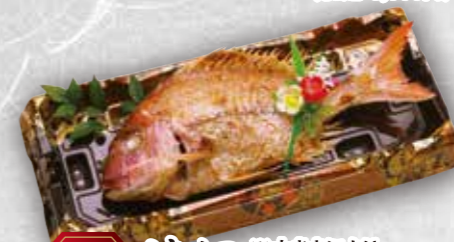
58 焼鯛 ※大きさにより 価格は変動いたします 本体価格 1,000円より (税込 1,080円)