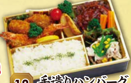
18 手造りハンバーグ & エビフライ弁当 紙箱入り 本体価格 1,600円 (税込 1,728円)