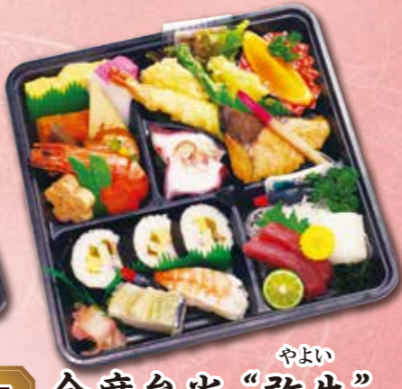
7 会席弁当“弥生” やよい 紙箱入り 本体価格 1,800円 (税込 1,944円)