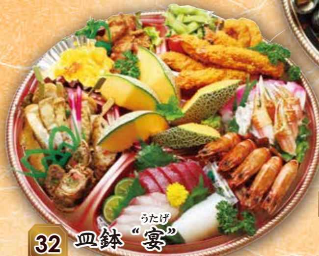
32 皿鉢 "宴" うたげ 本体価格 10,000円 (税込 10,800円)