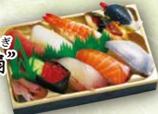
49 上にぎり寿司“扇” 本体価格 1,200円 (税込 1,296円)