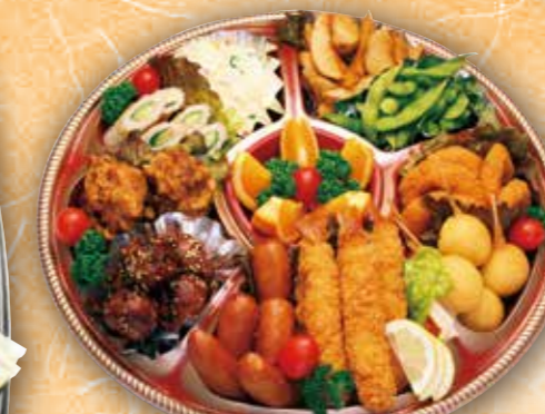
35 オードブル大 本体価格 3,000円 (税込 3,240円)