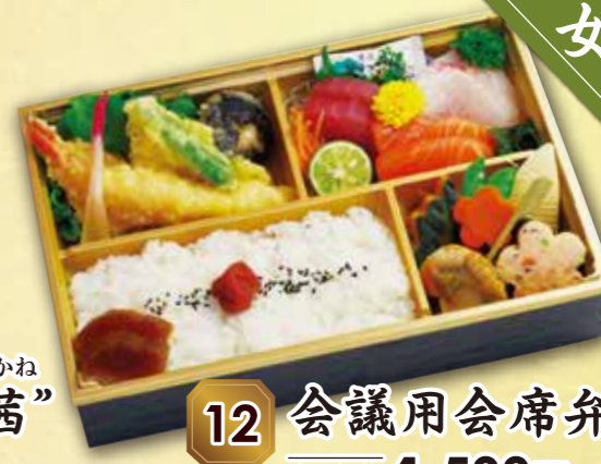
12 会議用会席弁当“藍” あい 紙箱入り 本体価格 1,500円 (税込 1,620円)