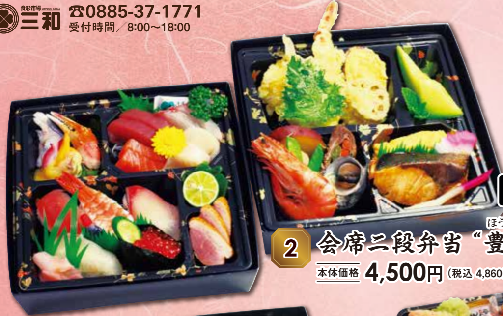
2 会席二段弁当“豊穰” 紙箱入り ほじょう 本体価格 4,500円 (税込 4,860円)