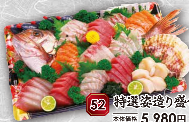
52 特選姿造り盛合せ 本体価格 5,980円 (税込 6,458円)