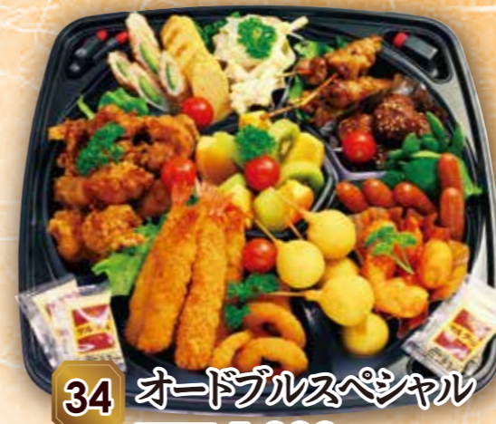
34 オードブルスペシャル 本体価格 5,000円 (税込 5,400円)