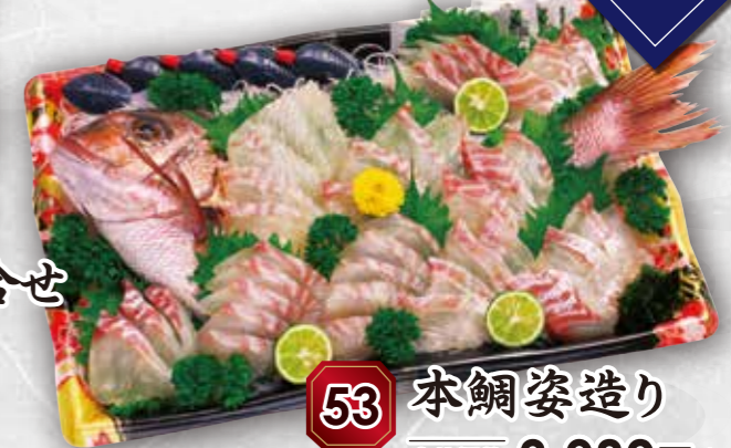
53 本鯛姿造り 本体価格 3,980円 (税込 4,298円)