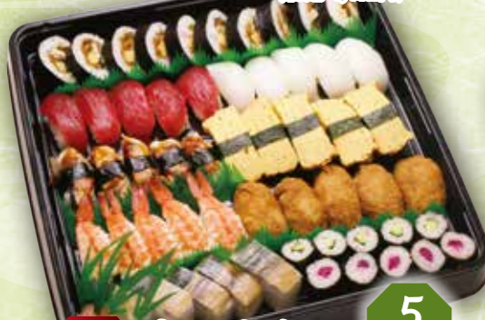
42 寿司盛合せ 5人前 本体価格 3,780円 (税込 4,082円)