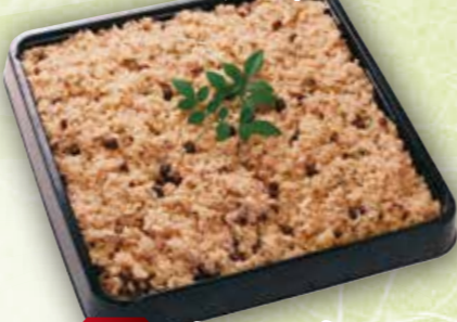
47 赤飯5合 本体価格 1,780円 (税込 1,922円)