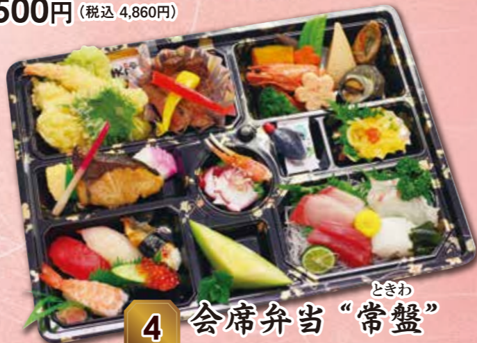
4 会席弁当“常盤” ときわ 紙箱入り 本体価格 3,500円 (税込 3,780円)