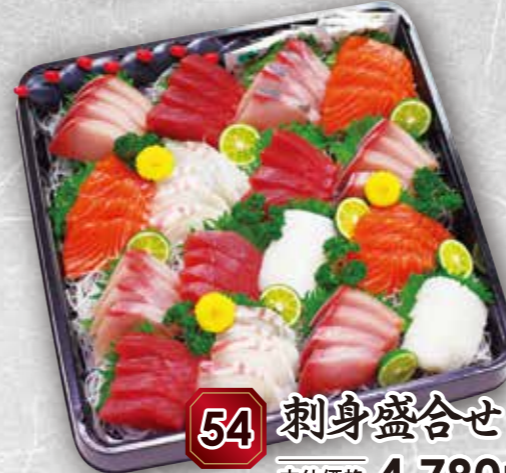
54 刺身盛合せ 7~8人前 本体価格 4,780円 (税込 5,162円)