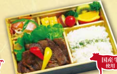
17 国産牛ステーキ弁当 国産牛使用 紙箱入り 本体価格 1,800円 (税込 1,944円)