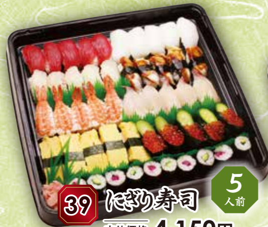
39 にぎり寿司 5人前 本体価格 4,150円 (税込 4,482円)