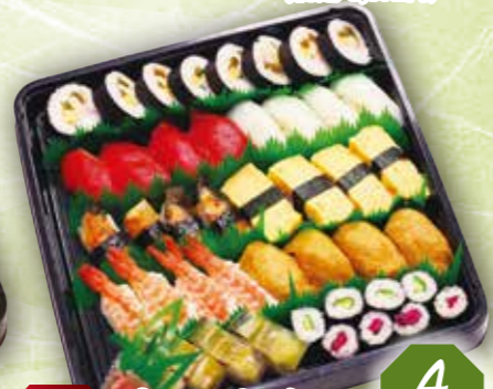
43 寿司盛合せ 4人前 本体価格 3,100円 (税込 3,348円)