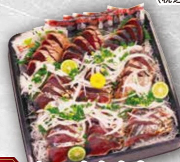
57 カツオたたき(解凍) 本体価格 2,200円 (税込 2,376円)