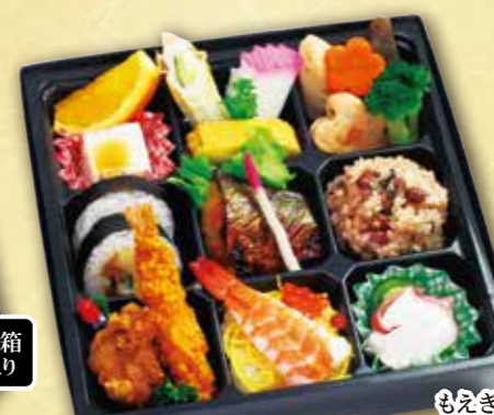
14 松花堂弁当“萌黄” もえぎ 紙箱入り 本体価格 1,200円 (税込 1,296円)