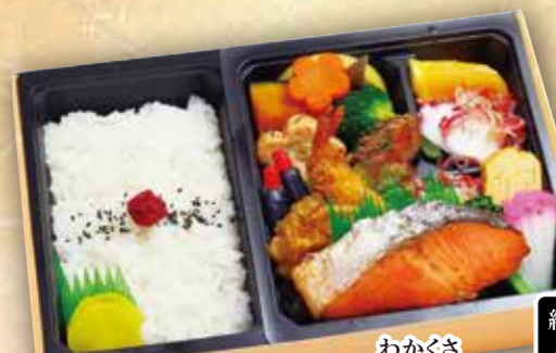
23 幕の内弁当 "若草" 紙箱入り わかぐさ 本体価格 1,000円 (税込 1,080円)