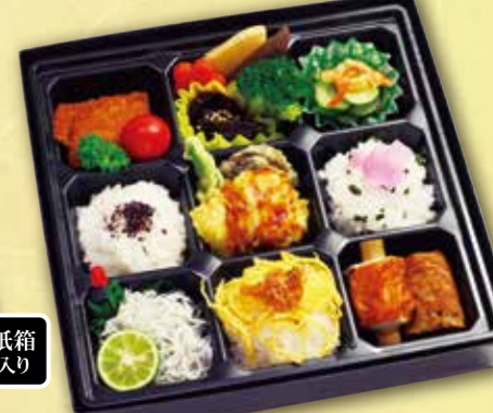
15 まるごと小松島弁当 紙箱入り 本体価格 1,100円 (税込 1,188円)