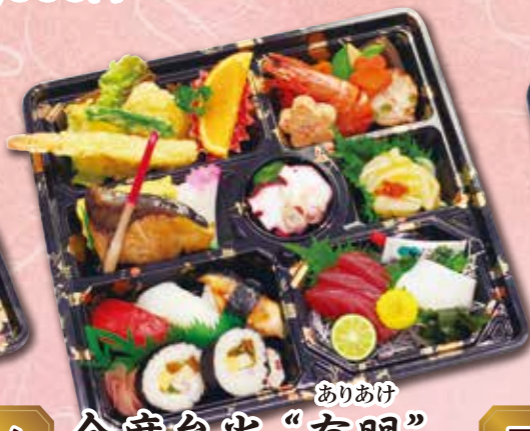
6 会席弁当“有明” ありあけ 紙箱入り 本体価格 2,100円 (税込 2,268円)