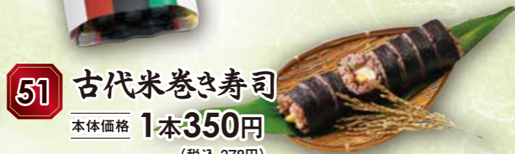
51 古代米巻き寿司 本体価格 1本350円 (税込 378円)