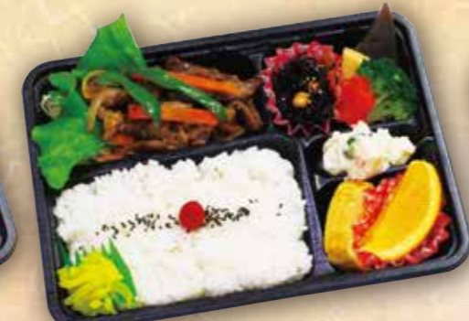
27 焼肉弁当 本体価格 600円 (税込 648円)