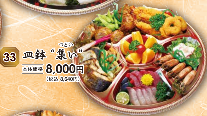
33 皿鉢 "集い" つどい 本体価格 8,000円 (税込 8,640円)