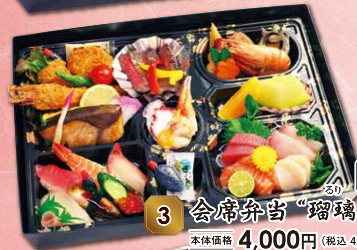
3 会席弁当“瑠璃” 紙箱入り り 本体価格 4,000円 (税込 4,320円)