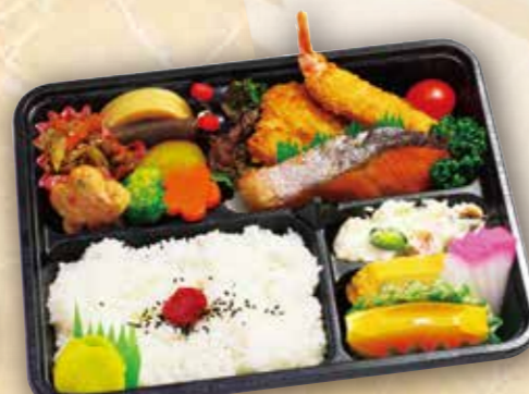
24 幕の内弁当 本体価格 800円 (税込 864円)