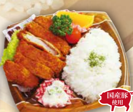
25 国産豚トンカツ弁当 国産豚使用 本体価格 600円 (税込 648円)