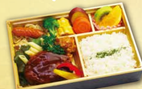
19 手造りハンバーグ弁当 紙箱入り 本体価格 1,500円 (税込 1,620円)