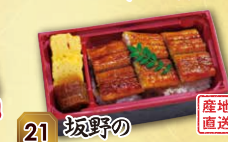
21 坂野の 森吉さんのうな重 産地直送 紙箱入り 本体価格 2,000円 (税込 2,160円)