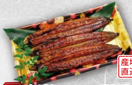
59 坂野の 森吉さんのうなぎ蒲焼 ※写真は3尾です 本体価格 1尾当り1,980円 (税込 2,138円)