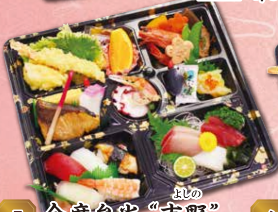
5 会席弁当“吉野” よしの 紙箱入り 本体価格 2,400円 (税込 2,592円)