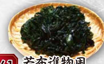
61 若布進物用 本体価格 100g当り150円 (税込 162円)