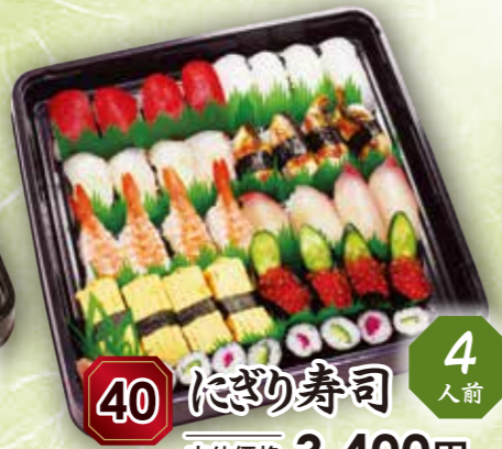
40 にぎり寿司 4人前 本体価格 3,400円 (税込 3,672円)