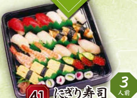
41 にぎり寿司 3人前 本体価格 2,600円 (税込 2,808円)