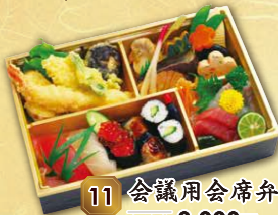
11 会議用会席弁当“茜” あかね 紙箱入り 本体価格 2,000円 (税込 2,160円)