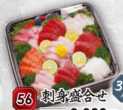
56 刺身盛合せ 3~4人前 本体価格 2,380円 (税込 2,570円)