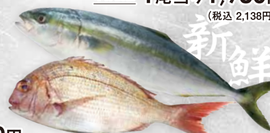
62 本鯛・ブリ・ハマチ 1本売り承ります