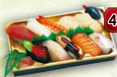
48 上にぎり寿司“舞” 本体価格 1,500円 (税込 1,620円)