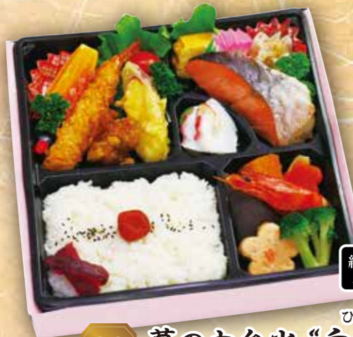
22 幕の内弁当 "向日葵" 紙箱入り ひまわり 本体価格 1,200円 (税込 1,296円)

みずほのさと 和田島の自社農園「瑞穂乃里」で採れた ご飯が美味しいと評判の御弁当です 数が必要な場合も お気軽にご相談ください