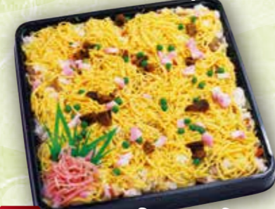
46 ちらし寿司5合 本体価格 1,980円 (税込 2,138円)