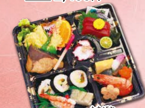
8 会席弁当“橘” たちばな 紙箱入り 本体価格 1,600円 (税込 1,728円)