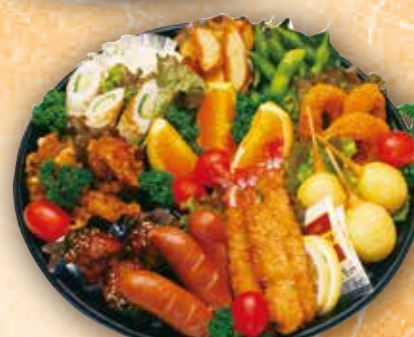
36 オードブル中 本体価格 2,000円 (税込 2,160円)